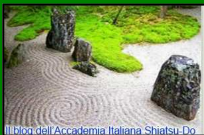
Il blog dell'Accademia Italiana Shiatsu-Do

TUTTO QUELLO CHE AVRESTE VOLUTO SAPERE SULLO SHIATSU (MA NON AVETE MAI OSATO CHIEDERE. O NON VI HANNO MAI VOLUTO DIRE)